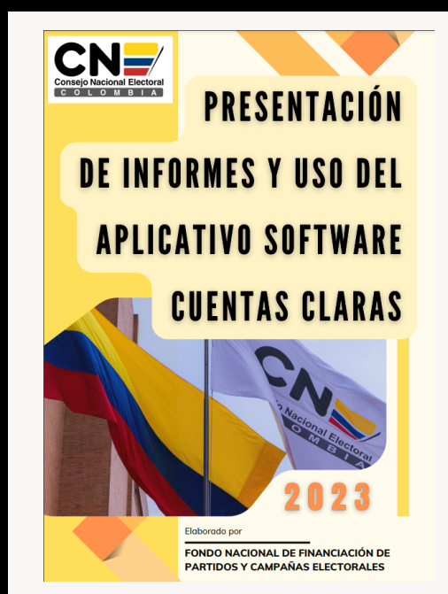
“PRESENTACIÓN DE INFORMES Y USO DEL APLICATIVO SOFTWARE CUENTAS CLARAS”